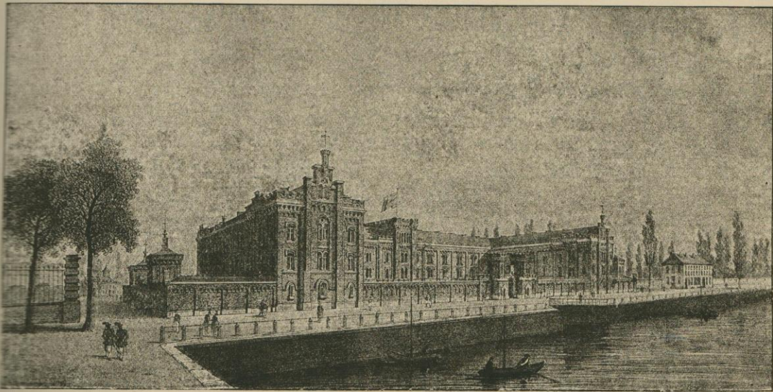
LA CASERNE DU PETIT-CHATEAU.

Les faubourgs, qui au delà forment maintenant des cités plus peuplées et plus riches que bien des chefs-lieux de province, n'avaient encore qu'une insignifiante importance. C'étaient de coquets villages groupés dans la verdure, autour de quelques clochers effilés; c'étaient des toits rouges, jetant une note gaie dans les frondaisons touffues, et, de-ci de-là, des cheminées d'usines naissantes, des guinguettes